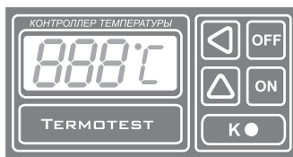
Рис.1 Передняя панель прибора.

Система автоматически определяет подключен датчик к прибору или нет, а также обрыв в датчике или соединительных проводах. В этом случае на индикаторе появляются три черточки по середине (- - -) и блокируется работа коммутирующего элемента (реле). Аналогичная ситуация возникает если температура датчика опускается ниже 0 °C или повышается выше 400 °C.